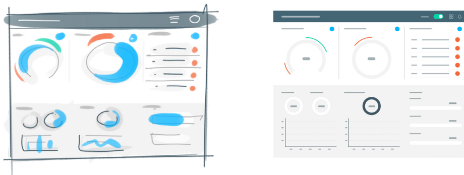
Über Scribbles, Wireframes und Screendesigns iterativ zum Ergebnis.

Des Weiteren zählen die Erstellung von Interaktionskonzepten, Wireframes, Mockups und User Interfaces unter Berücksichtigung von Corporate Design Vorgaben zu Deinen Aufgaben.